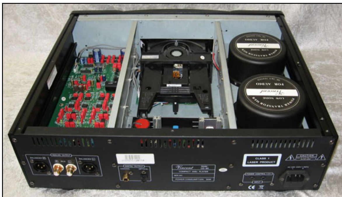
Vincent CD-S5 set bagfra.

Det er den, for undertegnede, velkendte Vincent finish som går igen her. Fronten er lavet af flere stykker aluminium, som er sat sammen, og med forskellig finish. De yderste paneler er skuret, mens midten er sandblæst. Siderne er ligeledes i aluminium, her som kraftige profiler, og også toppen er udført i aluminiumsplade.