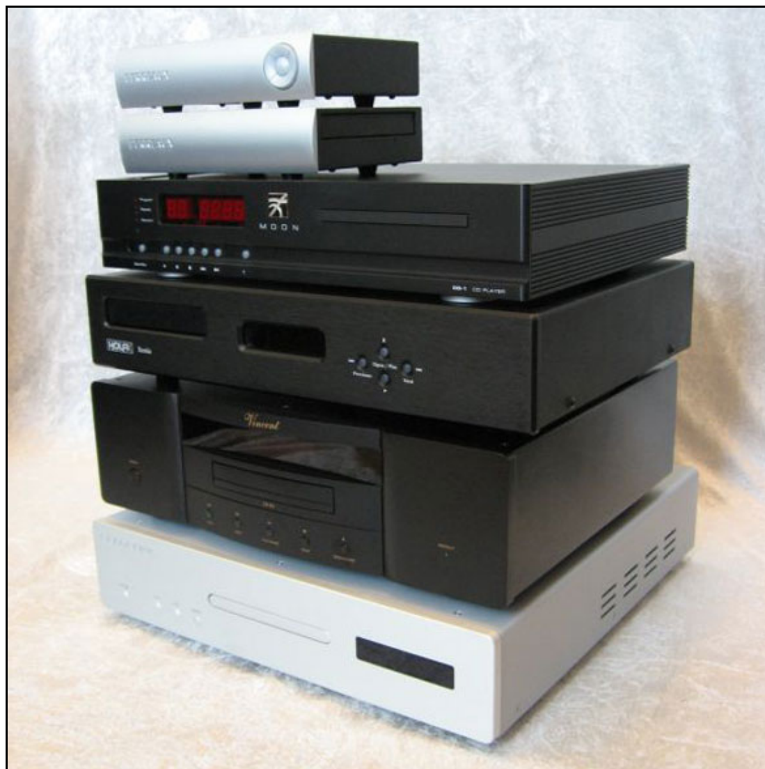
Nedefra og op: Bladelius Syn, Vincent CD-S5, Holfi Xenia DC, Moon CD-1 og Perraeux SXCD.

Valget faldt på en svensker, en dansker, en canadier, en new zeelænder, og en tysk kineser. De fem deltagere har alle noget specielt at byde på, enten i form af teknik eller anderledes løsninger, bl.a. har en af deltagerne batteridrift, og en anden er todelt og har hverken display eller fjernbetjening.